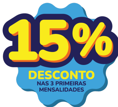
TABELA SEM DESCONTO. APLICAR CONDIÇÃO SOMENTE ATÉ AS VIGÊNCIAS DE MAR/26.